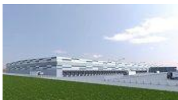
Computerschets Lidl distributiecentrum

Tenge Hoveniersbedrijf gaat het onderhoud uitvoeren van het groen rond het nieuwe Lidl distributiecentrum. Dit grote complex ligt op het Internationaal Bedrijvenpark Friesland in Heerenveen. Het vloeroppervlak is maar liefst 46.000 m 2 .